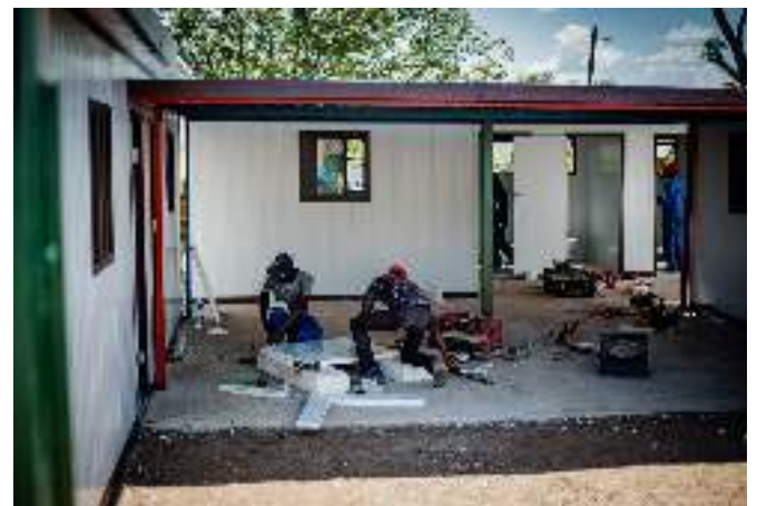
Die neue KITA wird durch eine lokale Firma gebaut und durch die freiwilligen Teams finanziert sowie finalisiert.