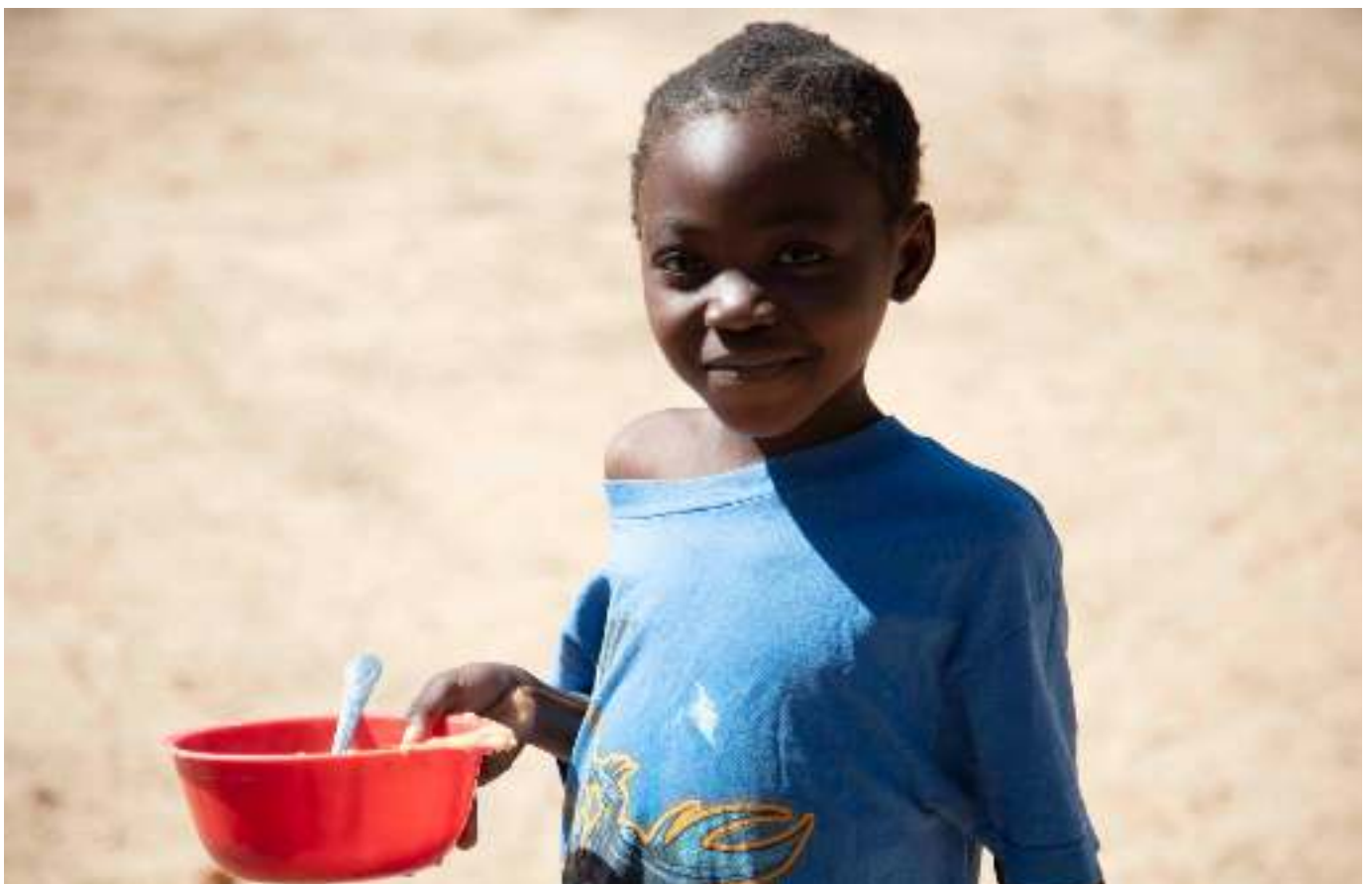
Die rote Schale, gefüllt mit einer nahrhaften Mahlzeit, verändert die Leben von zahlreichen Schulkindern.

In einigen Schulen konnten wir bereits Brunnen bohren, Latrinen bauen und Schulgärten anlegen, wovon die gesamte Dorfgemeinschaft profitiert.