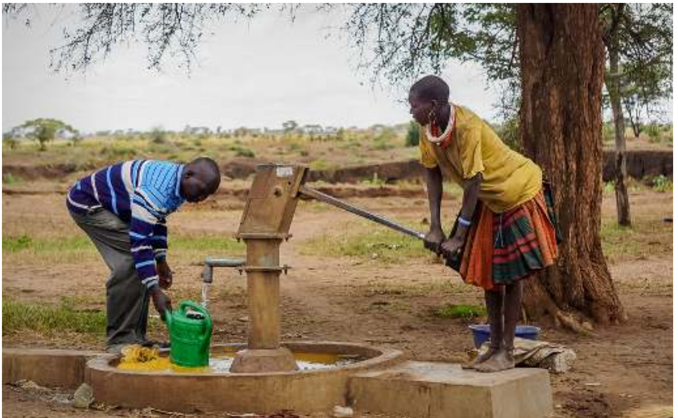
Eine nahegelegene und saubere Wasserquelle fördert die Gesundheit, Land- und Viehwirtschaft sowie Ernährungssicherheit.

In der ersten Phase des Projektes haben wir uns auf umfassende Abklärungen vor Ort konzentriert und die Zusammenarbeit mit den lokalen Behörden, Gemeinschaften und Organisationen eingeleitet. Parallel dazu wurde eine Sensibilisierungskampagne durchgeführt, um die EinwohnerInnen im Umgang mit Wasser und Hygiene zu schulen. Bereits in diesem frühen Stadium konnten wir 14 Brunnen erfolgreich sanieren und einen neuen Brunnen bohren.