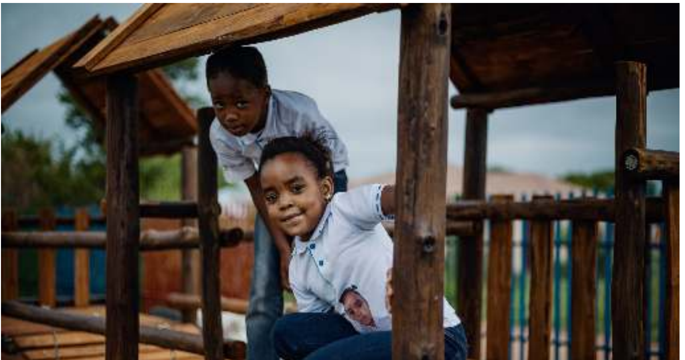
Die neuen KITAs bieten den Kindern ein sicheres Umfeld, in welchem sie gesund aufwachsen können.